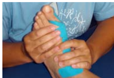
Ein ausführlicher Befund ist die Grundvoraussetzung für eine erfolgreiche Therapie