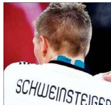
Leistungssportler vertrauen auf KT, da es schnell Abhilfe schafft und nicht einschränkt.