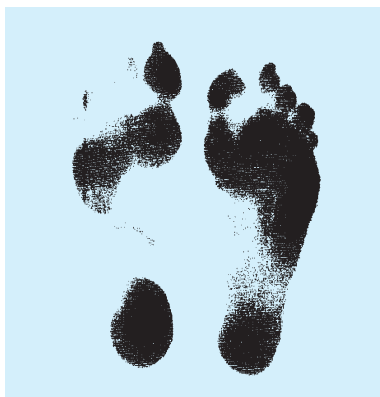
Dynamischer Fußabdruck eines Patienten mit Beinlängendifferenz.

Das sensorische Nervensystem, das über mehrere Mechanismen den Muskeltonus bestimmt, reagiert jetzt und übt den Reiz aus, mit dem es die Muskelspannung verändert. Reflektorisch folgen ganze Muskelketten. Das führt zu Gelenkblockaden mit Änderung der Statik. Der Patient ist „aus dem Gleichgewicht“.