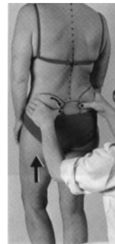
Die Funktionsdiagnostik des Beckengelenks (ISG) setzt ein hohes Maß an Fachwissen voraus.